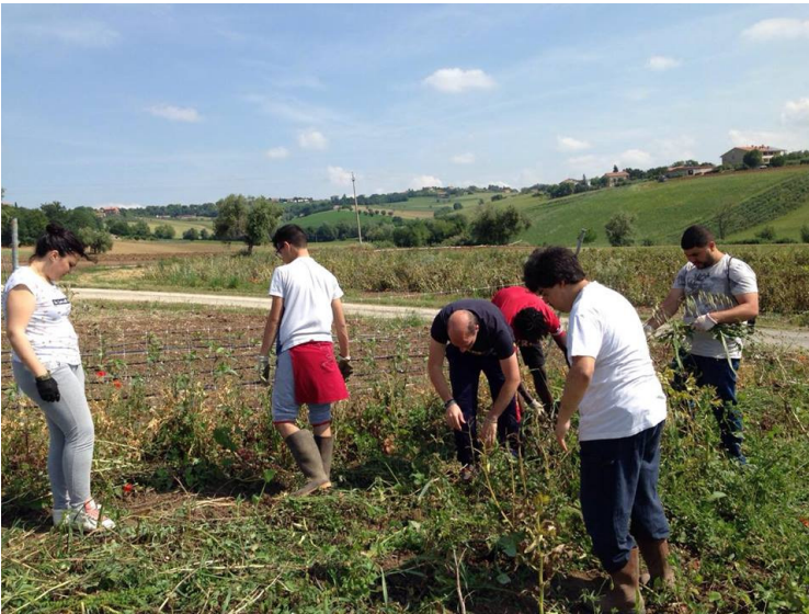
Attività di agricoltura sociale