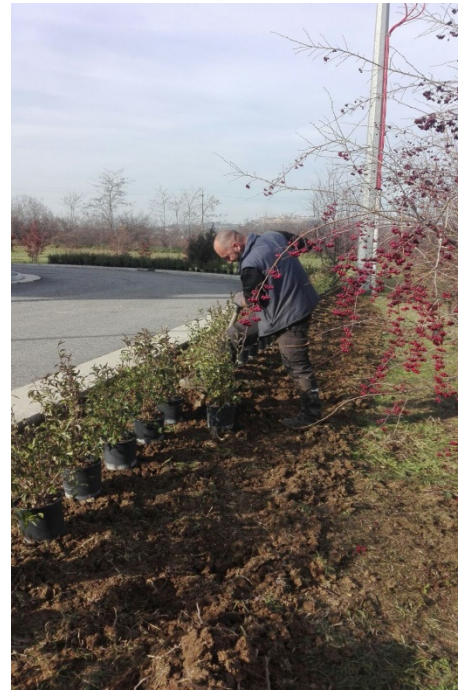
cura del verde pubblico